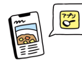
レシピサイトやアプリの利用